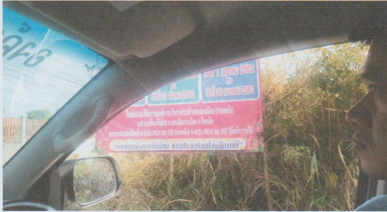
หมู่ที่ ๕