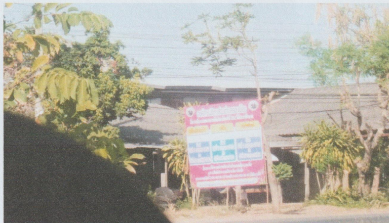
หมู่ที่ ๖