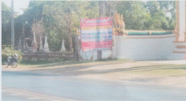
หมู่ที่ ๔